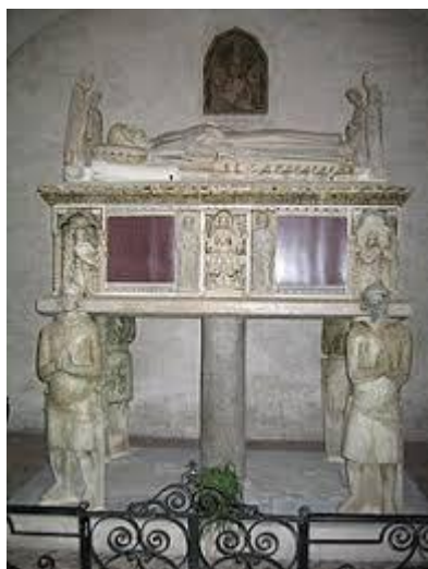
Chiesa S. Giustina

CHIUSURA ISCRIZIONI AL RAGGIUNGIMENTO MAX 40 ASSOCIATI