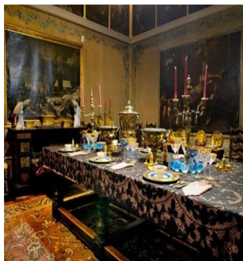
Palazzo Minucci De Carlo